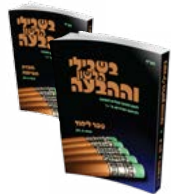
לכיתות ה' / ו'

כל נושא הנלמד מובא על שני צדדיו; בתחילה, התלמידים נחשפים לנושא ממבט של "קורא", ובשיעור שלאחר מכן מיישמים את הנלמד במשימת הבעה תואמת.