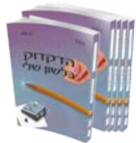
לכיתות ד' - ח'

סדרת ספרים המגישים לילד את כל המידע הלשוני הנדרש לפי תכנית הלימודים, שלב אחר שלב, נדבך ע"ג נדבך. בצורה ספירלית נערכת הקניה חכמה, מדורגת בדרך מעניינת וברורה. במהלך הלמידה מודגשת גם השפעת הלשון על ההבנה וההבעה.