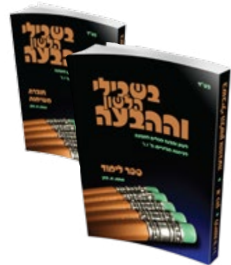
לכיתות ה' / ו'

כל נושא הנלמד מובא על שני צדדיו; בתחילה, התלמידים נחשפים לנושא ממבט של "קורא", ובשיעור שלאחר מכן מיישמים את הנלמד במשימת הבעה תואמת.