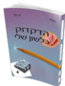
לכיתות ד' - ח'